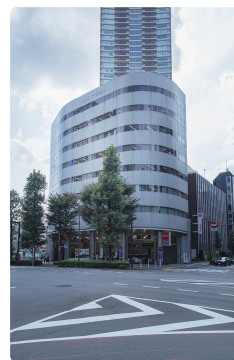
▲ 池袋パークビル外観です

平日 午前 9:30～午後 5:00 (正午 12:00～午後 1:00 を除く)