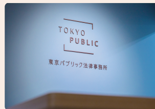
▲ 当事務所のロゴです