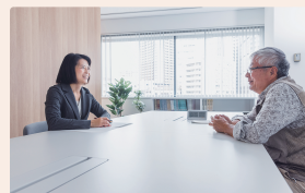
▲ どなたもお気軽にご相談ください

ご相談に関する資料をご持参 ください。 あらかじめ事情を整理してお いていただくと相談がスムー ズに進みます。